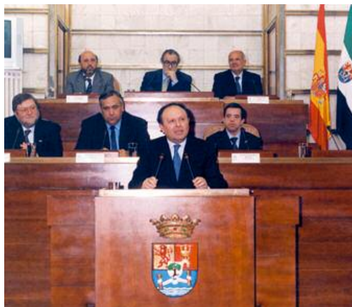
Acto de entrega del Premio Asociación Síndrome de Down de Extremadura

La Entidad concede el 0,7% del Presupuesto de su Obra Social a organizaciones no gubernamentales de colaboración con el Tercer Mundo. En esta línea, durante 2003 se han concedido ayudas a las siguientes organizaciones: Alianza de Solidaridad Extremeña (ASE), en los proyectos Kenya y II Festival Benéfico ASE a favor del Proyecto de Construcción del Colegio "César Vallejo" en Perú, Asociación de Ayuda Social Ecológica y Cultural de España (ADASEC), Manos Unidas: Kenya, Asociación Comité Ipiranga, Asociación de La Fuente Pro Ayuda y Solidaridad (ALFAS): Perú, Asociación para la Cooperación al Desarrollo en el Ámbito Municipal (ACODAM): Bolivia, Misioneros Extremeños en Zimbabwe, Asociación de Amigos del Pueblo Saharaui Extremadura, Médicos sin Fronteras, Asociación Celíaca de Extremadura a favor de la población Saharaui, y Asociación Extremeño-Cubana de Solidaridad.