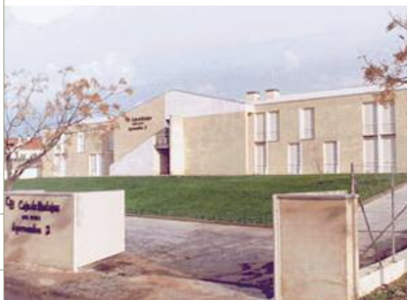
Centro Aprosuba de Badajoz

La atención de las necesidades de los discapacitados psíquicos, una constante entre los destinos de nuestra Obra Social, se materializa en la entrega de equipamientos, vehículos, o aportaciones puramente económicas, a las distintas asociaciones dedicadas a su educación, rehabilitación e inserción laboral, aunque sin lugar a dudas, la actuación más destacable la configuran los centros ocupacionales y educativos construidos y equipados por la Caja para este colectivo.