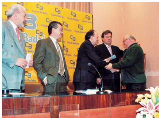
Entrega de ayudas para la lucha contra la droga 2003

Tradicionalmente la lucha contra la droga ha ocupado un papel destacado en las actuaciones de la Obra Social. Numerosas asociaciones y entidades extremeñas, dedicadas a la rehabilitación de los afectados y a la concienciación de la sociedad, se han beneficiado de este capítulo para el desarrollo de sus actividades, siendo el importe total destinado para ello en 2003 de 240 miles de euros. En los últimos cinco años, la Caja ha entregado a este fin 1.200 miles de euros.